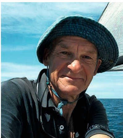
L'auteur de ces lignes. 40 ans de passion pour les petits bateaux simples et légers.

De Houat, le cap est mis sur Port-Haliguen par un bon force 5 de Noroît excluant de tenter le passage de la Teignouse vers Belle-Ile. Plus tard, avec une fenêtre météo favorable, j'appareille