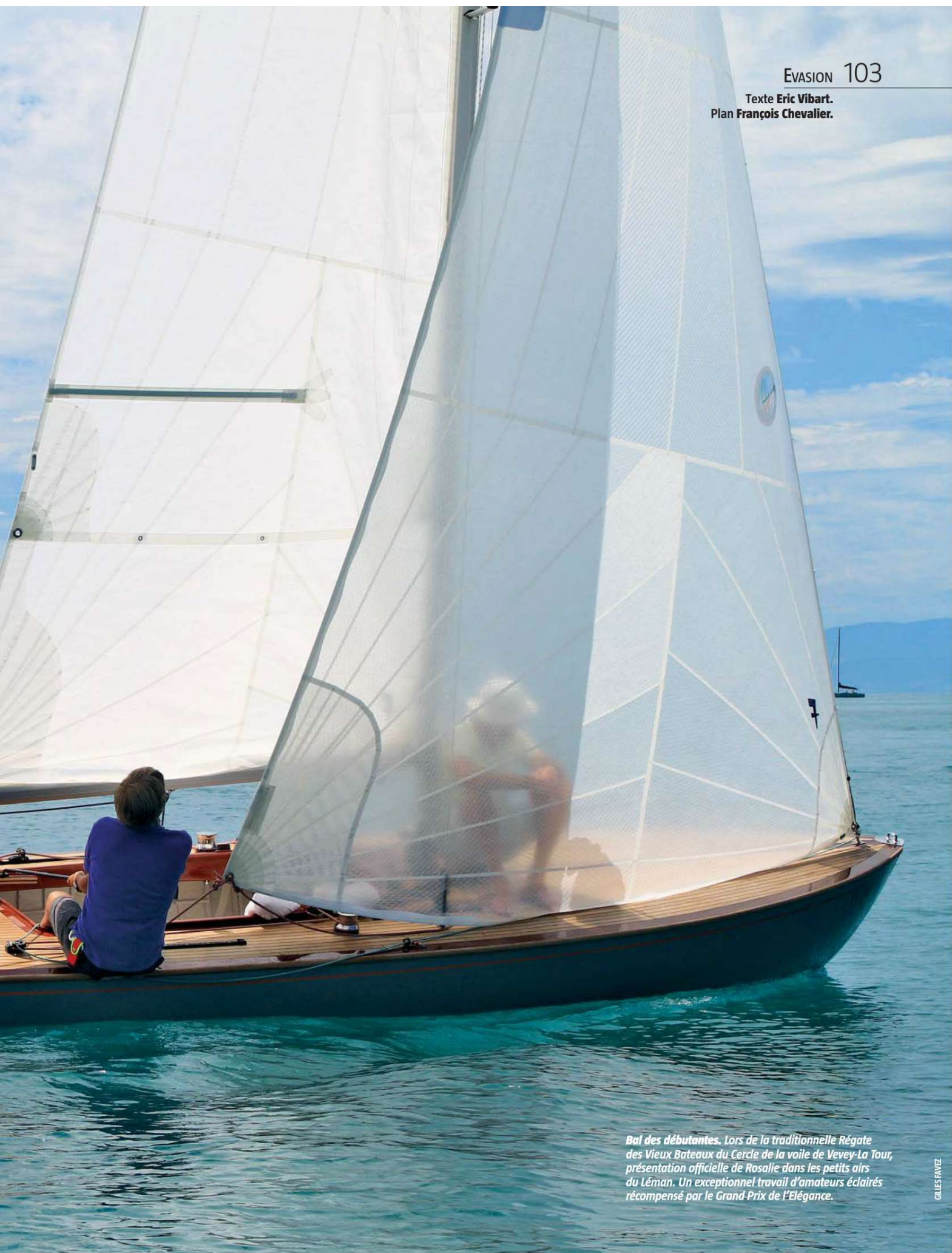
Bal des débutantes. Lors de la traditionnelle Régate des Vieux Bateaux du Cercle de la voile de Vevey-La Tour, présentation officielle de Rosalie dans les petits airs du Léman. Un exceptionnel travail d'amateurs éclairés récompensé par le Grand Prix de l'Élégance.

Texte Eric Vibart. Plan François Chevalier.